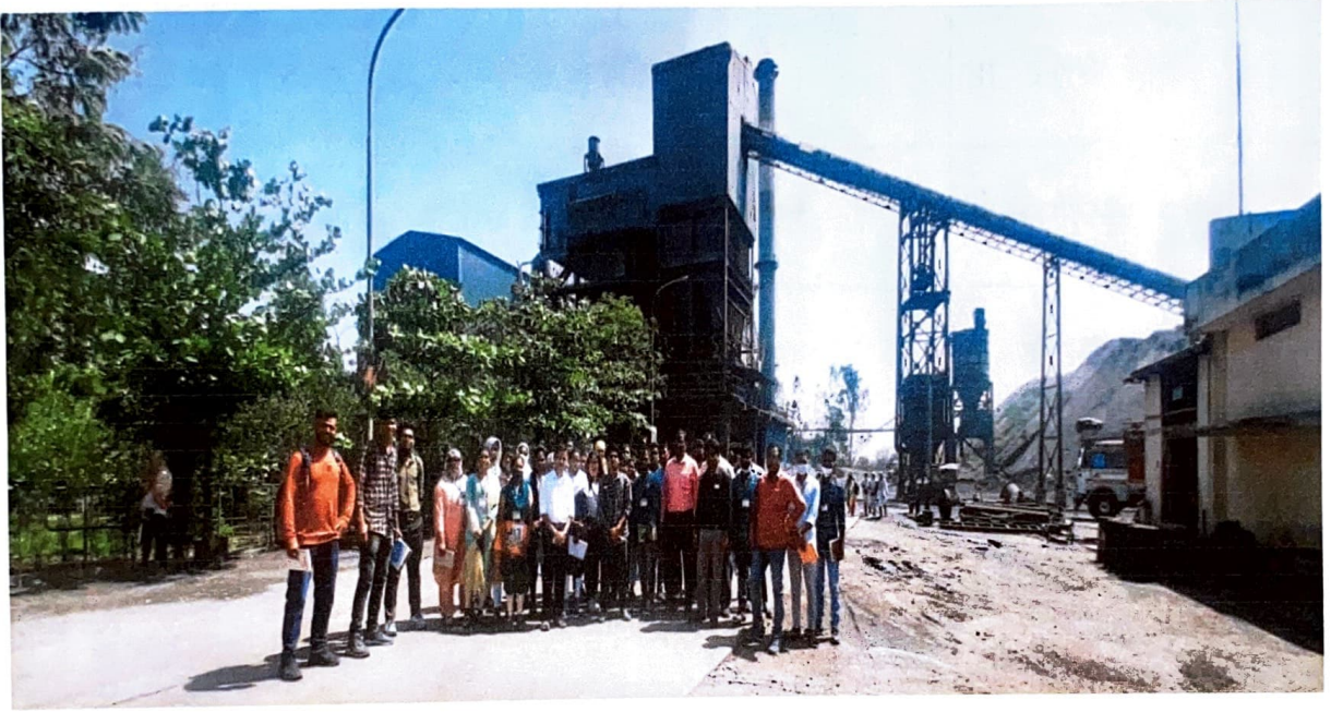
वडसा येथील विद्युत तयार करणारी कंपनी