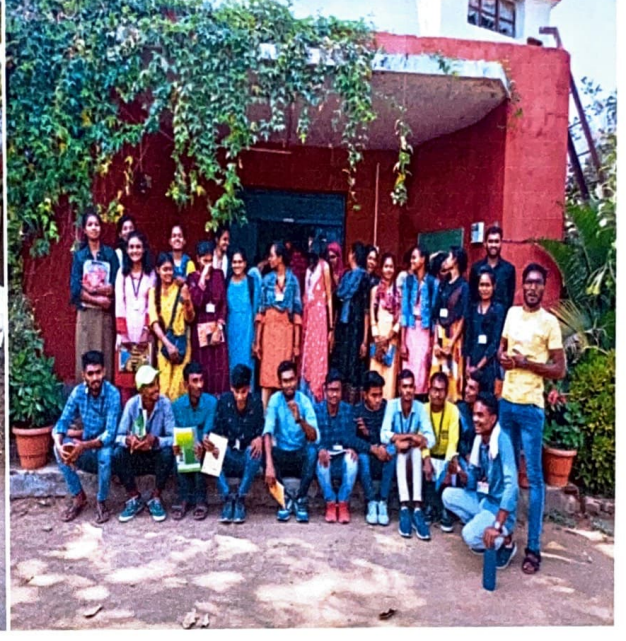
लोक बिरादरी प्रकल्प